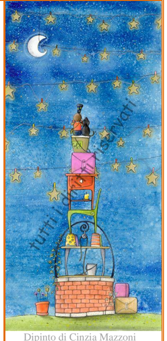
Dipinto di Cinzia Mazzoni

Sezione di Livorno del WWF Italia in collaborazione con la SAIT (Società Astronomica italiana) e il Museo di Storia Naturale di Rosignano organizza per la Notte di San Lorenzo una serata di osservazione del cielo sui Monti Livornesi in località Aia della Vecchia (Nibbiaia)